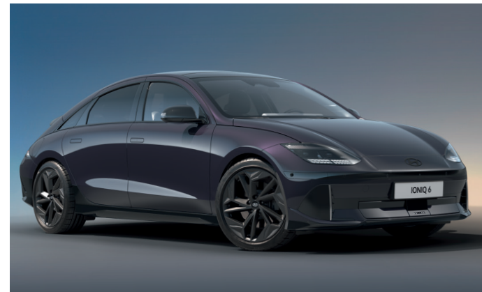
Einzigartige Details, wie glänzend schwarze Seitenspiegel und glänzend schwarze Zierleisten an Front, Heck und Seite, unterstreichen das elegante Außendesign.