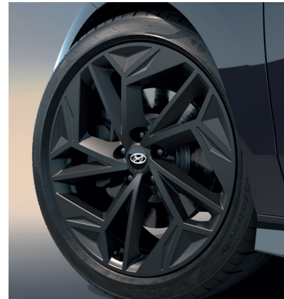
Auf Blickfang: 20-Zoll-Leichtmetallfelgen mit mattschwarzem Finish.