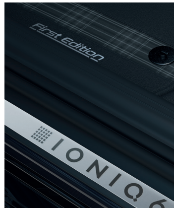
Die eigens für das First Edition Paket gefertigten Fußmatten zeigen ihren exklusiven Charakter durch Designelemente in Grey Tartan und eine „First Edition“-Stickung.