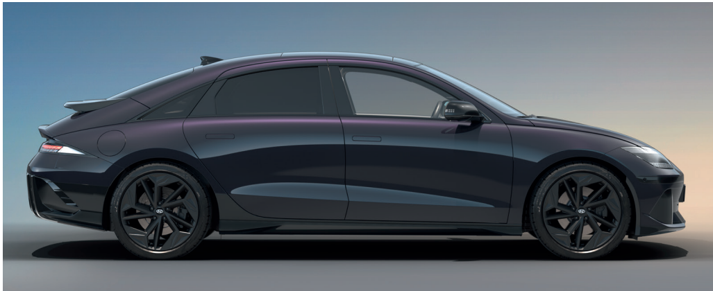
Der IONIQ 6 mit First Edition Paket ist in vier Farben erhältlich: Serenity White Pearl, Nocturne Grey Metallic, Gravity Gold Matte und Biophilic Blue Pearl (hier abgebildet).

Mit dem First Edition Paket hebt der IONIQ 6 den eleganten Look seiner einzigartig aerodynamischen Silhouette auf das nächste Level. Das dynamische Design der stromlinienförmigen E-Limousine wird durch exklusive Styling-Elemente innen und außen zusätzlich aufgewertet. Darüber hinaus bietet das First Edition Paket das höchste Ausstattungsniveau, Allradantrieb und eine reichweitenstarke 77,4-kWh-Batterie. Dazu erhalten Sie ein kostenloses Jahresabonnement für das IONITY Premium Paket 1 , mit dem Sie zu einem ermäßigten Tarif Zugang zu einem der größten Hochleistungs-Ladernetze Europas haben. Der IONIQ 6 mit First Edition Paket ist auf 2.500 Fahrzeuge in Europa limitiert – für Sie die exklusive Gelegenheit, diese richtungsweisende E-Limousine als einer der Ersten zu fahren, sobald die Auslieferung beginnt.