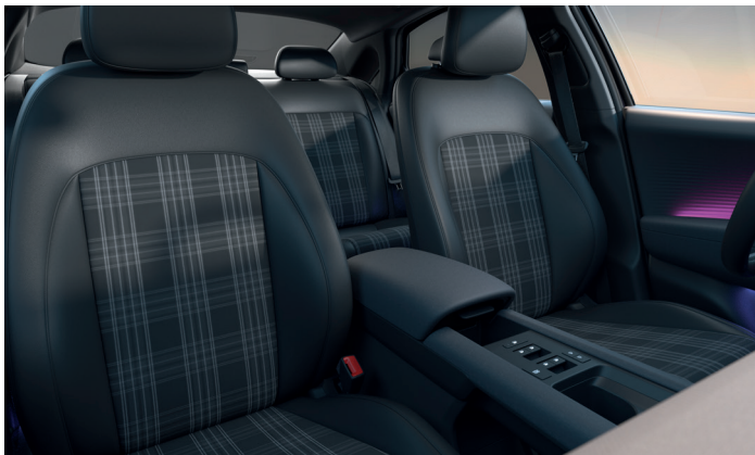
Das schwarze Interieur bietet Sitze in der exklusiven Kombination von Leder und Grey Tartan sowie einen schwarzen Dachhimmel.